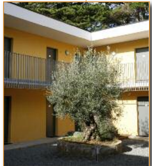
Nouvel hébergement patio

L'approche générale de conception de l'agence DUNET part de la fonction. L'expression architecturale, elle, répond au contexte.