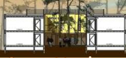
Nouvel hébergement dessin façade et coupe