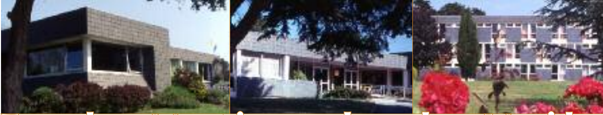
Vue des bâtiments administratifs, formation et hébergement