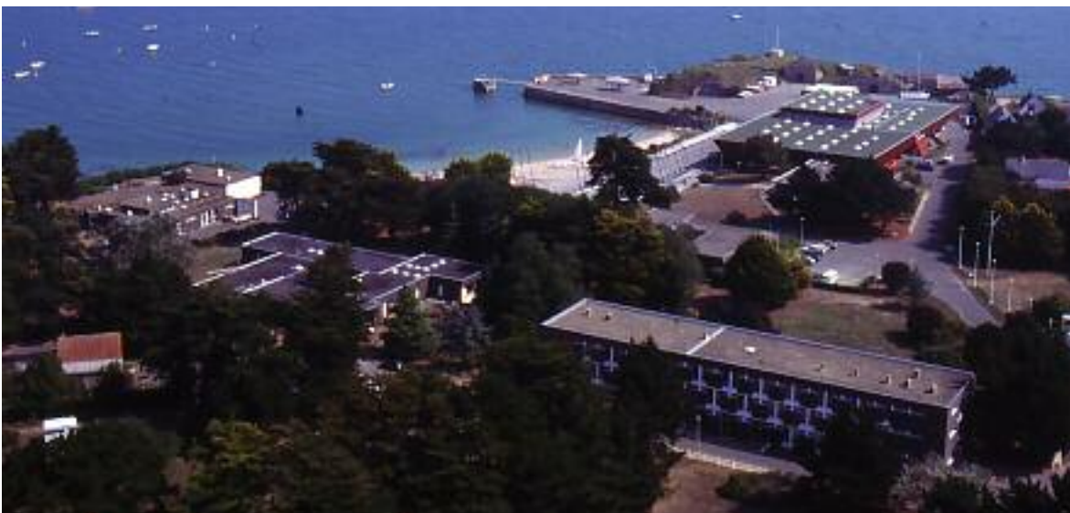
Vue aérienne de l'Ecole Nationale de Voile