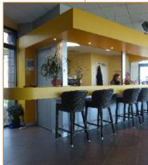
Cafétéria, le bar

Lors de la conception puis de la réalisation, l'intégration à toujours été une priorité : intégrer le programme, les demandes d'utilisateurs, du personnel, l'économie du projet, l'environnement d'un site magnifique, et l'esprit original de l'ENV.