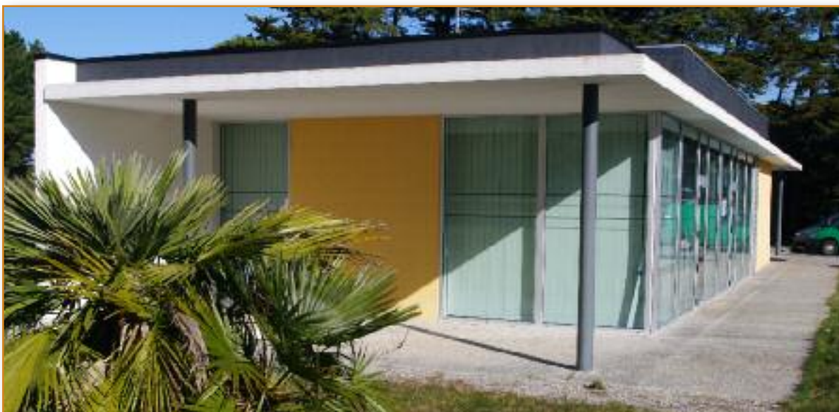
Nouvel hébergement perspective façade