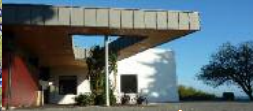
Entrée bâtiment restauration et cafétéria Dessin façade et perspective