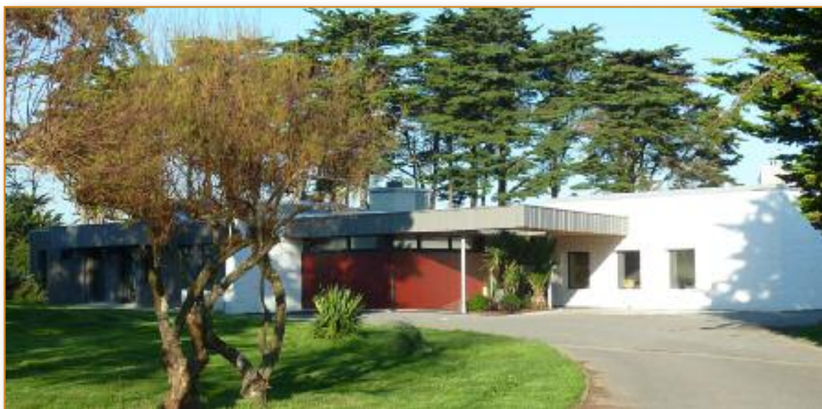
Bâtiment restauration et cafétéria Façade entrée cuisine et restauration