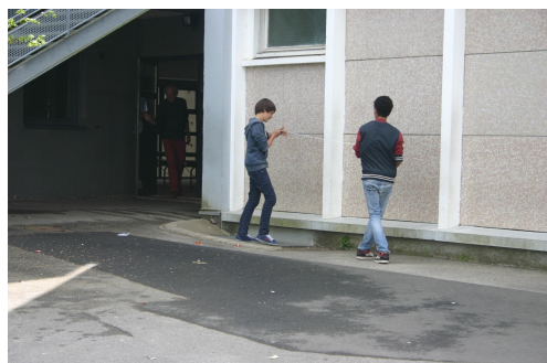
Mesure de la trame constructive, Elèves du Collège de Beaumanoir, Ploërmel. 2014